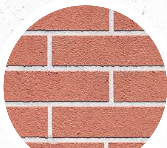
Beton / Ziegel